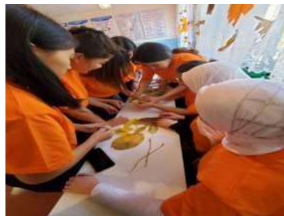
Открытый урок- Дебат, посвященный ко дню людей с ограниченными возможностями (инвалидов)