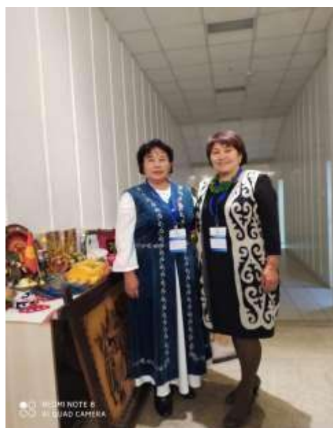
Участники пленарного заседания в Техно-парке МГТУ города Минска