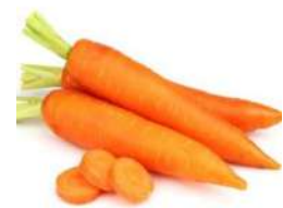
фото зона “Күзгү жагымдуу маанай”